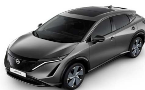
KAD Gun Metallic