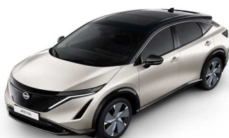
XGV Warm Silver / Black