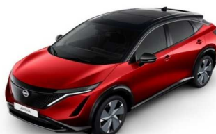
XGD Tinted Red / Black