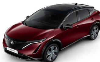
XGG Burgundy / Black