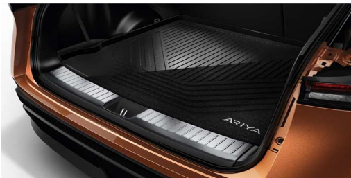
Terskelplate, bakluke og bagasjeromsmatte, vendbar