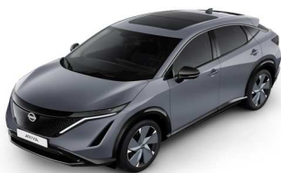
KBY Ceramic Grey