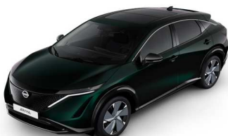
DAP Aurora Green