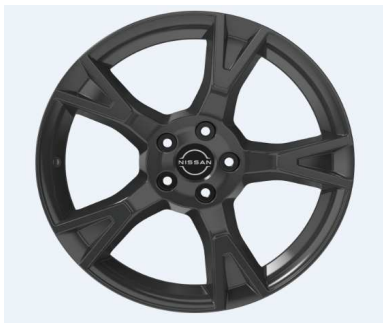
19" Alufelg vinterhjul