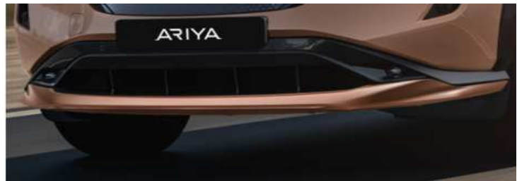
Stylingplate foran, Copper

*Informasjon om tilbehør er kun ment som generell veiledning og innholdet skal hverken anses som et tilbud eller en presentasjon av Nissan. Prisene er veiledende og inkluderer monteringskostnader, unntatt montering av takstativer. Leverings- og monteringskostnader kan variere, ta derfor kontakt med din lokale autoriserte Nissan-forhandler for nøyaktige priser. Tilbehørsprisene gjelder ved kjøp og fakturering sammen med ny bil og vi tar forbehold om eventuelle endringer i avgifter. Tilbehør og annet utstyr som ettermonteres på biler kan innvirke på forbrukstall.