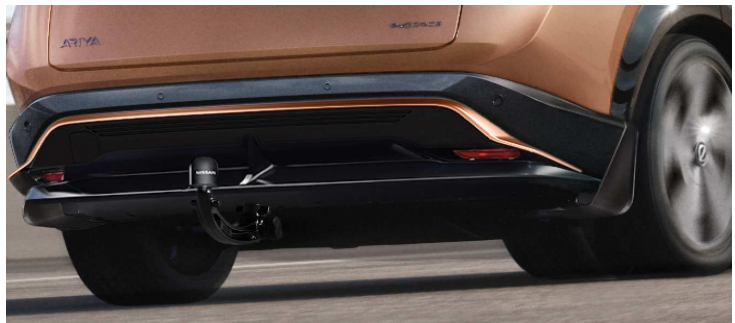
Stylingplate bak - Copper, skvettlappsett og avtagbart tilhengerfeste