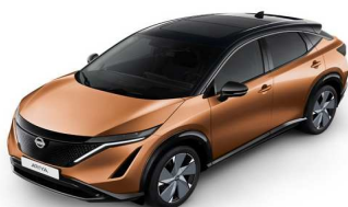
XGJ Akatsuki Copper/ Black