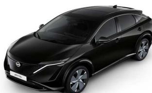
GAT Pearl Black