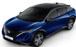
XGU Blue Pearl / Black